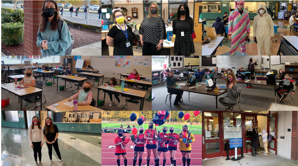
Aun los cubrebocas no disimulan la emoción de estar de vuelta en el campus!