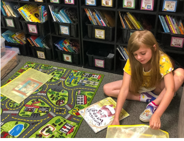
Bibliotecas dentro del aula, continúa

Una de nuestras prioridades como distrito es proporcionar una Instrucción de Alfabetización de Alta Calidad mediante el cultivo de una cultura de la lectura. Nuestra esperanza es que cada estudiante tenga un amor por la lectura y se vea a sí mismo como un lector y escritor, y que cada estudiante participe activamente como lector y escritor en un aula rica en alfabetización.